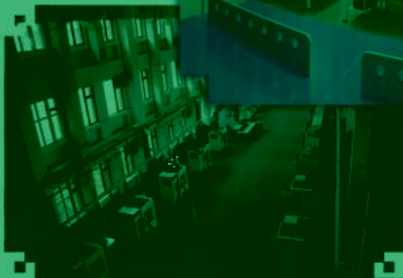
DMC 数控技术 训练场所